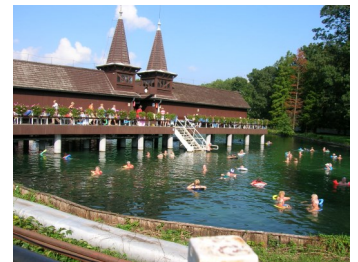
Bade temperatur i Héviz-sjøen fra 27 utendørs til 34 grader innendørs