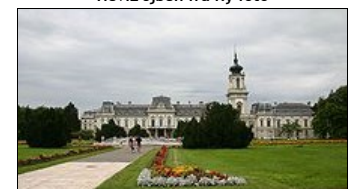
Festetics slott i Keszthely