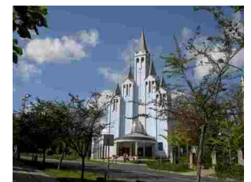
Héviz katolske kirke.