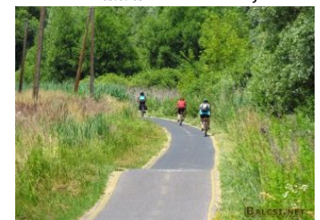
Sykelsti langs Balaton