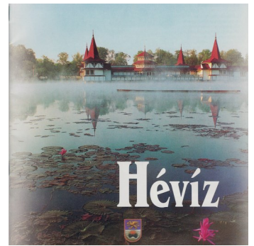
Vannliljene i Héviz sjøen

DAG 3 MANDAG 4. august HÉVIZ Kl.07.-10.00 Frokost serveres hver dag i restauranten. Dagen foregår med aktiviteter iflg. program og om noen ønsker tur sjekker vi sykler eller bare vandrer oppover i bolig- og vinhageområdene i høydedraget over hotellene. Kl.19.30 Felles middag i restauranten og samling for de som ønsker i baren eller terrassen.