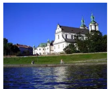
Kloster i Krakow

Idereiser as, Verdalsveien 28, 4352 Kleppe, Tlf. +47 51 42 57 44, Mobil +47 909 77 141