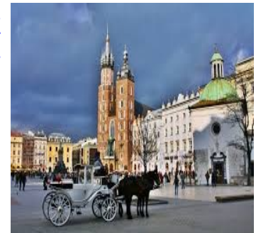
Mariakirken i Krakow

Vedr. vår skreddersydde reise til Krakow med direktefly tur / retur destinasjonene så fremt det er mulig. Vi flyr til Krakow med Norwegian. Vi må ta forbehold om endringer i fly-ruter, valutaendringer, oljepris, miljø-avgifter og uforutsette endringer hos våre samarbeidspartnere. Vi gjør oppmerksom på at Covid-19 pandemi er kjent i ved produksjon av turen. Ved avbestilling etter 1.mai faktureres full faktura iht. våre kontrakter med hotell og flyselskap etc.