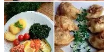
Bierhalle meny i Krakow